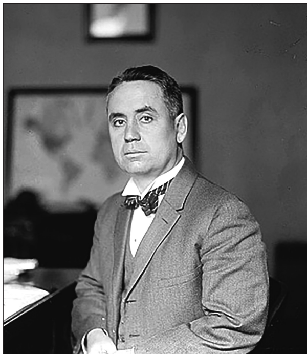
Fig. 1. Addison E. Southard, console generale degli Stati Uniti d'America ad Aden (1917-20), 7 ottobre 1922, Library of Congress Prints and Photographs Division Washington, D.C., LC-F8- 20774.

dell'Impero» 43 e come il suo agire avesse evidenti ricadute negative sugli interessi italiani e britannici nella regione. Si trattava di una questione da tempo nota e, per tutta la durata della guerra, gli interessi italiani e francesi in Etiopia furono conflittuali. L'elemento di novità nella comunicazione di Colli di Felizzano consisteva, invece, nella seconda parte del messaggio, dove si informava che, molto probabilmente, la Francia aveva prospettato all'Etiopia la possibilità di partecipare alla Conferenza della pace. Per l'Italia, la notizia era decisamente negativa: si trattava di uno sviluppo inatteso che coglieva tutti di sorpresa. Ad Addis Abeba,