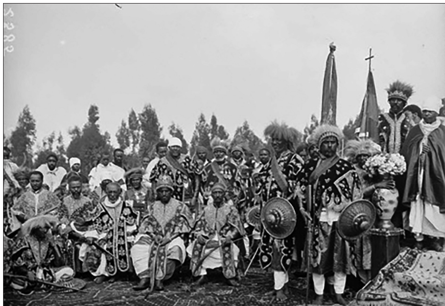
Fig. 5. I ministri del governo etiopico, Addis Abeba 11 febbraio 1917, © Amédée Alphonse Eywinger/ECPAD/Défense, SPA 43 E 2385.

nei primi due anni di guerra, e quelle che venivano definite le «manovre degli agenti turco-germanici», parevano avere influenzato laḡ Iyasu e la cerchia dei suoi consiglieri, ora sempre meno propensi a continuare nell'atteggiamento di stretta neutralità sino allora osservata. 101 La valutazione complessiva era che Germania e Impero ottomano tentassero in tutti i modi di sfruttare «le propensioni islamiche e le giovanili baldanze dell'erede al trono, risuscitando le antiche aspirazioni nazionali di uno sbocco al mare, fomentando artificiosi sentimenti irredentisti e soprattutto gli istinti di preda delle popolazioni». 102 In quei giorni, commentando