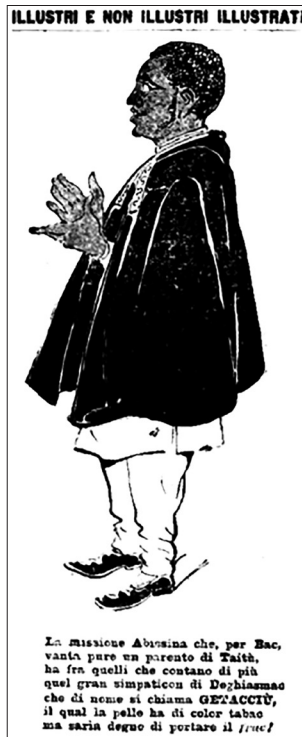
Fig. 2. Illustri e non illustri illustrati , in «Il travaso delle idee», 1005 (1919).

A partire dal 1917, l'Italia impresso un'accelerazione alle proprie rivendicazioni territoriali e, oltre a pretendere maggiori spazi lungo le coste della Dalmazia e il Mediterraneo, cominciò a vagheggiare una propria egemonia sul Corno d'Africa. Per la prima volta dopo la sconfitta di Adua, l'Italia inseguì il sogno di estendere il proprio controllo su tutto il Corno d'Africa, allontanando dalla regione la Francia, riducendo l'influenza britannica e, soprattutto, offrendo all'Etiopia una sistemazione che la trasformava in un protettorato italiano, sebbene non dichiarato. Un frangente storico molto delicato e complesso che, inevitabilmente, spinse l'Etiopia a reagire e contrastare il piano italiano. Quando si analizza il contesto in cui maturò questa iniziativa e si mettono a fuoco i suoi veri obiettivi, appare chiaro che queste tre missioni non furono affatto secondarie e che l'Etiopia, nella fase finale