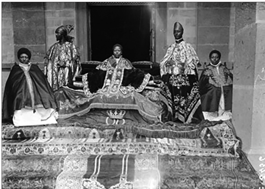
Fig. 6. L’Imperatrice Zäwditu davanti al suo palazzo, Addis Abeba, 1° febbraio 1917, © Amédée Alphonse Eywinger/ECPAD/Défense, SPA 43 E 2456.

frabile il posizionamento dell’Etiopia nella Grande guerra: il paese rimaneva neutrale, ma le relazioni con l’Intesa potevano dirsi completamente ripristinate. Il nuovo governo, una sorta di triumvirato costituito dall’imperatrice, Zäwditu, figlia di Mənilək, da ras Täfäri Mäk w ännən, nominato erede al trono e capo del governo, e da fitawrari Habtä Giyorgis, ministro delle guerra, mandò a questo proposito segnali molto chiari: tre giorni dopo il colpo di stato, ras Täfäri, in presenza dell’intero governo, ricevette i rappresentanti di Francia, Gran Bretagna, Italia e Russia, un’attenzione che, volutamente, non venne riservata agli ambasciatori di Germania e Turchia. La perdita d’influenza degli Imperi centrali era evidente, ma l’imperatrice si oppose, come consigliato dagli inglesi, all’espulsione dei rappresentanti dell’Impero ottomano e della Germania. 138