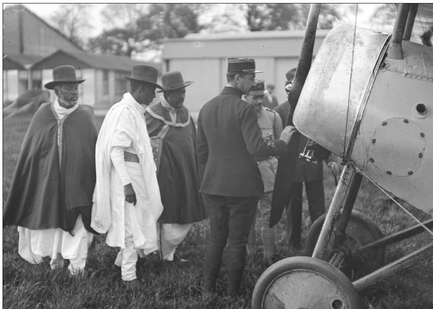
Fig. 2. Gustave Louis Michel Alaux, Un ufficiale mostra alla missione alcuni dettagli di un aereo , Villacoublay, Seine et Oise, 16 maggio 1919, © Gustave Alaux/ECPAD/Défense, SPA 61 IS 2007.

incontrarono re Alberto I al quale rimisero le lettere di Zāwditu e ras Tāfāri e alcuni regali. 60 Alberto I ricambiò decorando i membri della delegazione con la Plaque de Grand Officier de l'Ordre de Léopold . 61 Terminato l'incontro, la delegazione passò il resto della giornata a visitare la città e il museo coloniale. Il giorno successivo, il piccolo gruppo visitò alcune fabbriche nell'area di Charleroi, 62 per concludere la giornata a Bruxelles in visita al municipio. L'ultimo giorno, i delegati si spostarono ad Anversa dove, dopo una veloce visita di cortesia al sindaco, visitarono il porto, il museo e la cattedrale. 63