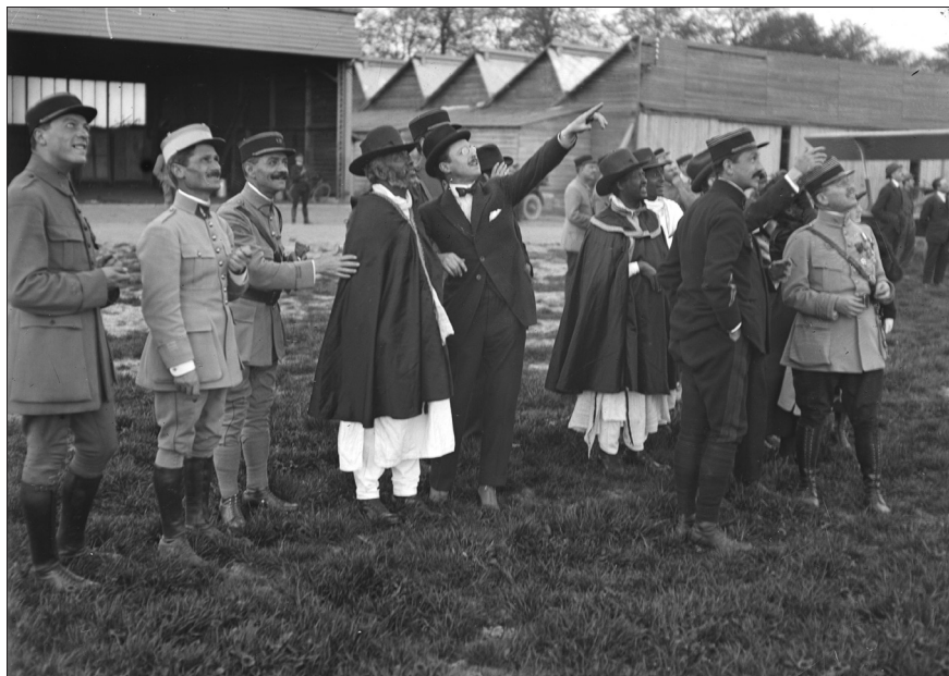
Fig. 1. Gustave Louis Michel Alaux, La missione etiopica assiste ad una dimostrazione di volo, Villacoublay, Seine et Oise, 16 maggio 1919, © Gustave Alaux/ECPAD/Défense, SPA 61 IS 2003.

mo di Longschamps, suscitando sempre viva curiosità nei presenti. 57 Il 24 maggio, la delegazione fu ricevuta da Clemenceau, a cui rimisero un assegno di 30.000 franchi per i militari mutilati e ciechi. 58 Poi fu la volta di una nuova giornata passata fra gli aerei, questa volta al campo d'aviazione di Le Bourget, a nord-est di Parigi. In quest'occasione, secondo quanto riportato dalla stampa, alcuni delegati ebbero il loro battesimo dell'aria. 59