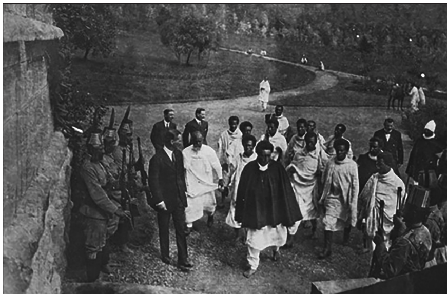
Fig. 2. Visita di ləḡ Iyasu alla Regia Legazione italiana, Addis Abeba, 1913 (?)