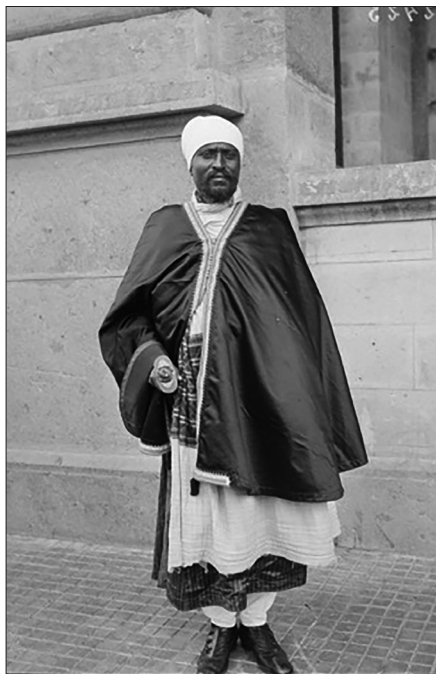
Fig. 4. Bäyyänä Yāmār, ministro degli Affari Esteri etiopico dal 1914 al marzo 1917, Addis Abeba, 1° febbraio 1917, © Amédée Alphonse Eywinger/ECPAD/Défense, SPA 43 E 2423.