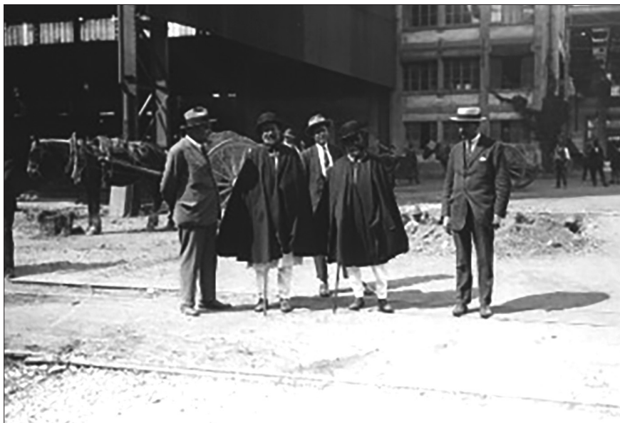
Fig. 6. Visita della missione etiopica agli stabilimenti Breda, Milano 10 giugno 1919, cortesia Archivio Storico Breda.

cittadina e numerosissimi ufficiali». 102 Anche a Torino la delegazione visitò i principali stabilimenti industriali della città, fra questi, ovviamente, anche la Fiat. Accolti dai dirigenti della fabbrica, la delegazione etiopica visitò i reparti di lavorazione meccanica, assistendo al montaggio dei veicoli, alla lavorazione di stampaggio e fonderia nei locali del Lingotto. L'attenzione della delegazione andò anche alla produzione civile: trattrici agricole, pullman per i servizi pubblici, e poi la Fiat mod. 501, in procinto di entrare in produzione. La giornata si concluse con un pranzo presso il «principesco» ed «elegantissimo» Restaurant Parc des Ambassadeurs al Valentino, dove gli ospiti si mostrarono molto contenti dell'accoglienza riservata. 103 Il giorno successivo, prima della partenza per Milano, la delegazione assi-