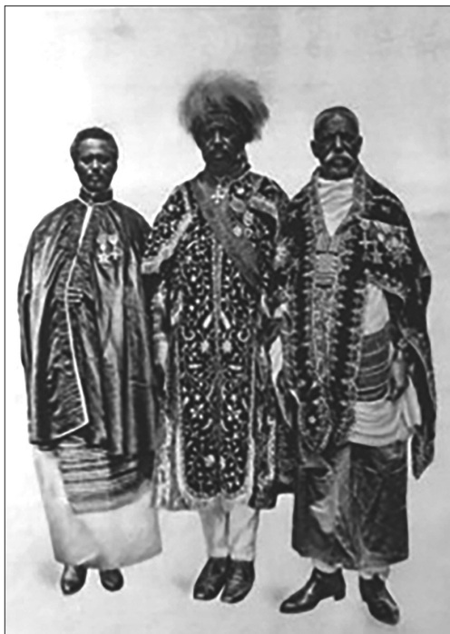
Fig. 7. La missione abissina in Gran Bretagna, «The Illustrated London News», 5 luglio 1919.

Nove giorni dopo il loro arrivo nel paese, il presidente Wilson ricevette alla Casa Bianca i membri della delegazione, per l'occasione la bandiera etiopica fu issata sulla Casa Bianca. 124 Durante la visita furono scambiate lettere e doni; qualche giorno dopo la delegazione offrì alla Croce Rossa 5000 dollari, per i feriti di guerra. 125 Come prassi, la delegazione visitò varie località del paese e una serie di stabilimenti industriali, tra i quali quello della Ford. 126 La tappa americana aveva però un significato molto particolare. Per l'opinione pubblica afroamericana la visita dell'u-